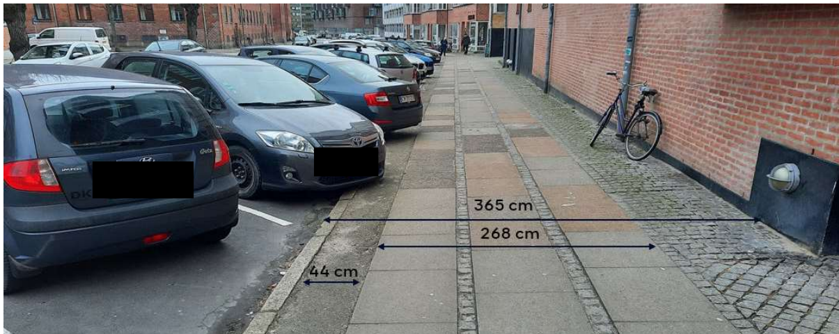
Eksempler på opmåling af eksisterende forhold