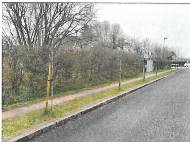
Billede 1 Træer i fortovets kant på Koreavej.