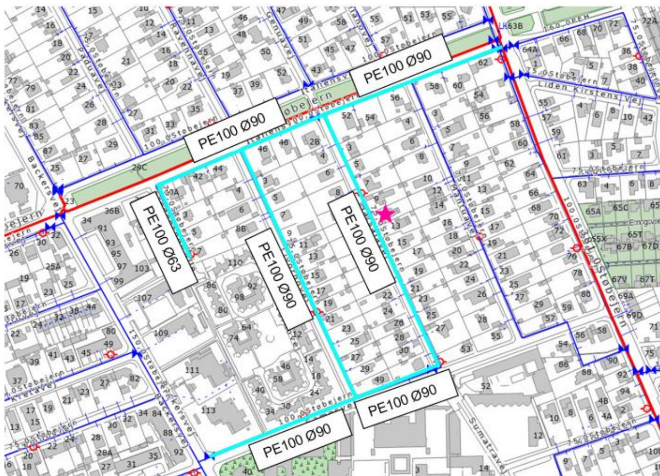
Figur 1 - Planlagt renoverede ledninger m. nye dimensioner og materialer

Ventilplacering er aftalt med Thomas Tofft fra Vand Drift. Brandhaneplacering koordineret med Ulrik Bjelbæk fra Hovedstadens Beredskab.